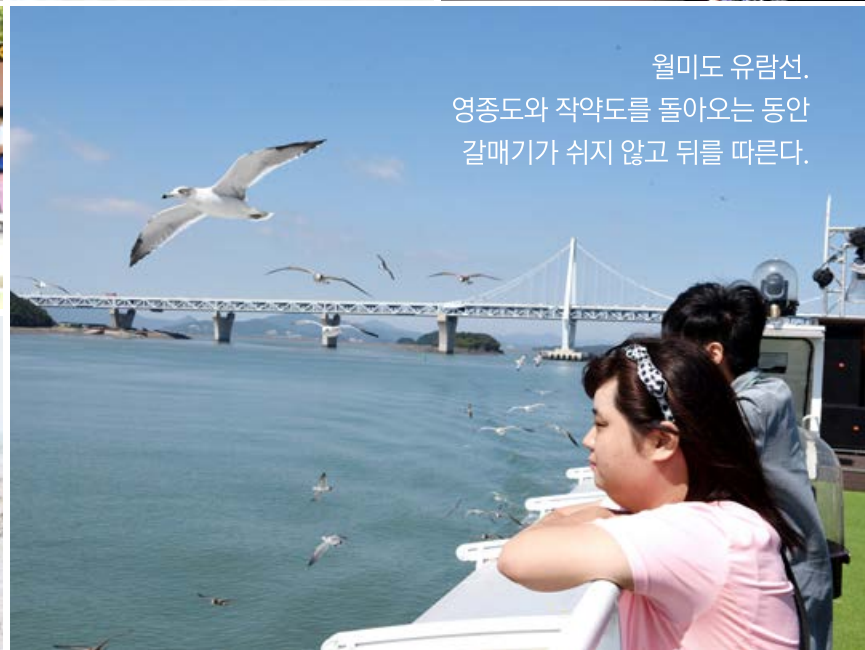
월미도 유람선. 영종도와 작약도를 돌아오는 동안 갈매기가 쉬지 않고 뒤를 따른다.