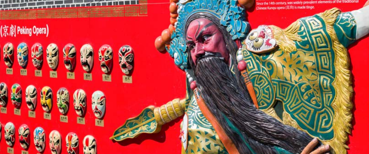
(京劇) Peking Opera