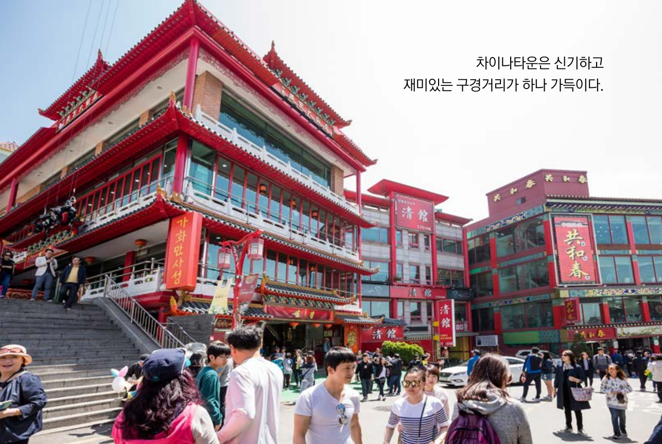
차이나타운은 신기하고 재미있는 구경거리가 하나 가득이다.