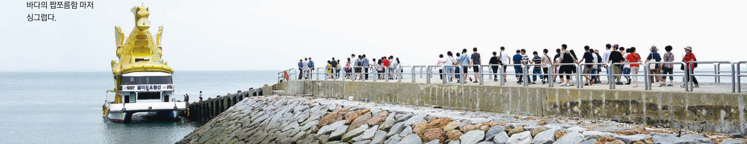
처음 탄 배, 처음 만난 바다! 바람결에 묻어오는 바다의 짭짤함 마저 싱그럽다.